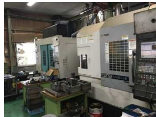
ロボット化を推進する工程(上)

また、ロボット化への設備投資について、費用対効果の検証や収支計画の策定等、当機関を交えながら、実施体制を含む事業計画の策定等について包括的に支援した。