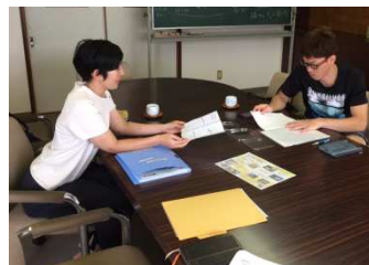
支援機関での支援風景

糺のしくみ、お店の歴史を十分にヒアリングし、販路の確保や売り方の工夫次第で、まだまだ販売拡大できると判断した。歴史ある糺屋としての誇りと風格を失うことなく、新しい展開をしていくために、「庄下ロゴマーク」の定着を図り、信頼感と歴史ある商品としての総合的な組み立てを提案した。ある種完成された現在の糺のパッケージを、その他の商品に生かすことと、創業年号と住所を堂々と明記も併せて提案した。地元販売用と地域外販売用の異なったパッケージデザインと、店頭で目を引かせるための文章表現も含めたPOP作成支援を行った。