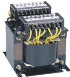
主力製品の制御トランス

本企業は岐阜県美濃加茂市と中国・浙江省に製造拠点を置き、各種変圧器の設計開発から製造までを行っている。納入先が大手メーカー及び商社であることから、顧客よりISO9001の取得を要請された。取得を目指す以上、社内全ての業務に適用でき、また高齢化していくベテラン従業員の技術、技能を形式知化してレベルの維持向上に活用できるようなISOシステムを構築したいと考えた。そこで、社内の品質保証体制の標準化と有効活用できるISOの取得について、当機関に相談があった。