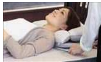
快眠ソリューションの取組み

はじめに、事業分野と事業の革新性について確認し、売上構成、顧客のニーズ、競合他社などから事業環境の棚卸を実施し、当店を「快眠ソリューションの店」としてポジショニングした。また、本企業の強みである個客とのコミュニケーション力と確かな計測技術から来る信頼関係を基盤に、3年後、5年後における達成目標を確認した。そのうえで、課題やアクションプランについて、重要度・緊急度から優先順位をつけることを指導し、それに対する施策がどのような効果をもたらすかを販売数量・単価・原価・経費から定量的に把握するために、月次決算でレビューを実施することが重要であると説明した。さらに、顧客×商品サービスのマトリックスによるターゲットの整理やマーケティングについてアドバイスし、5年後の売上数値設定等による事業計画作成を支援した。