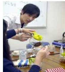
(紅茶の淹れ方とテイस्टングの指導風景)

また、認定店として認定されるまでの手続きについても助言し、認定の際に必要なこととして、協会調査員の心証を損なわないために紅茶の全般的な知識が必要であること及び茶葉の仕入先の選定方法についてもアドバイスした。