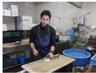
(鮮魚の加工イメージ写真)

まずはHACCP認証の考え方について説明するとともに、工場の製造工程を確認した。製造工程(一次加工品(フィレ)の受入 冷蔵保管 細断 調味 個包装 箱詰め 冷蔵保管 出荷)の各工程ごとに確認を行うとともに、効率面等改善できる箇所を洗い出すとともに、その改善方法を提案した。また、新工場のレイアウト(間取り)については、実際に建設予定地を訪れ、立地にあった効率的な加工工程となるよう間取りの設計方法等アドバイスした。