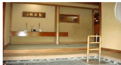
清掃後の玄関写真

今回の支援を受け、本企業は創業当時の美しい老舗料亭の姿を取り戻すことができた。生まれ変わった姿に感動したお客様が、他のお客様を案内する光景も見られ、新規顧客に繋がる効果となった。以前は閑散としていたロビーにも人が集まるようになり、居心地の良さから、なかなか帰ろうとしない状況も見られるなど、表面の美しさに留まらず、お客様の心に響く「おもてなし」が実現しつつある。清掃、整頓を保つことで、お客様に対するきめ細かいサービスの向上に現れている。