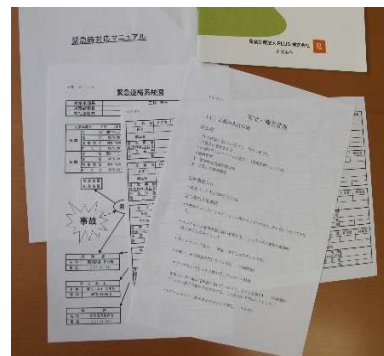
作成したマニュアル等

はじめに、「岐阜県HACCP認定制度」の導入及び一般衛生管理の拡充と構築について解説し、認定取得までのプランを立案した。次に製造工場内を視察したところ、商品等の品質管理の基礎力はあるものの、社内のルールとしてマニュアル化や記録化がされていないため、文書化と体制構築について支援した。具体的には、商品製造フローチャート、衛生管理マニュアル及び自主点検表の作成を支援するとともに、危害分析の実施、CCP(重要管理点)の抽出、商品回収プログラムの整理について指導し、これらを実施するためのプログラム構築について、社内でチームとして取り組む体制を作るようアドバイスした。そのうえで、岐阜県HACCP導入への申請手続きを支援した。